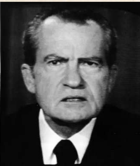
Ex - presidente Richard Nixon

A história das instituições modernas oscila entre o brilho e a desonestidade, sendo moldada por crises que redefiniram o conceito de confiança. Os escândalos Watergate e Enron seguem um ciclo idêntico: surgem da arrogância e prosperam na ocultação.