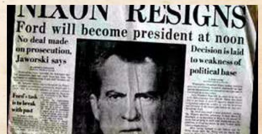
Jornal da época revelando a renúncia

O que parecia um crime comum no complexo Watergate revelou uma vasta rede de espionagem política e obstrução de justiça que abalou a democracia dos EUA. O escândalo culminou na inédita renúncia de Richard Nixon.