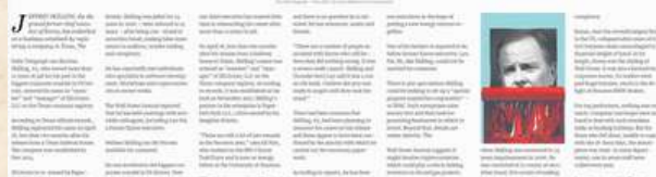
Jornal da época revelando a fraude