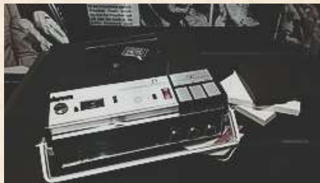
Gravador de fita Sony usado por Nixon para gravar todas as conversas no Salão Oval

Graças a informantes e jornalistas, o esquema foi exposto. Sem saída e diante de um impeachment inevitável, Nixon tornou-se o único presidente americano a renunciar ao cargo, em agosto de 1974.