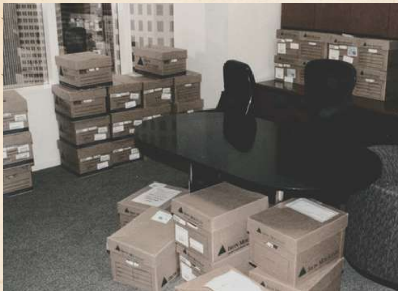
Mais de 3.000 caixas de provas e mais de quatro terabytes de dados digitalizados.