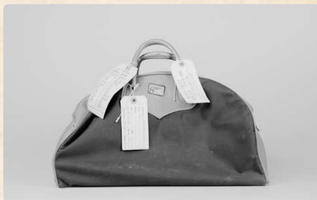
Bolsa com provas do ex-presidente Nixon

A partir daí, o escândalo escalou de um crime de espionagem para um massivo esquema de obstrução de justiça.