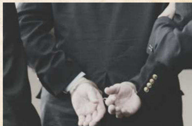
Ex-CEO da Enron, algemado, sendo levado por agentes do FBI

O colapso da Enron, em 2001, permanece o maior símbolo de corrupção corporativa da história moderna. Considerada por seis anos consecutivos a "empresa mais inovadora dos EUA" pela revista Fortune, a gigante do setor de energia não passava, na verdade, de uma sofisticada fachada financeira.