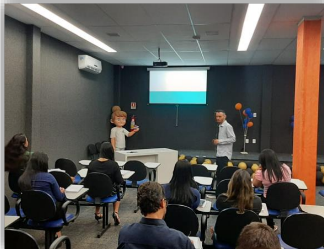
Treinamento de Capacitação dos Cipeiros

Temos o prazer de anunciar os resultados da eleição para a Comissão Interna de Prevenção de Acidentes e Assédios (CIPA) do grupo G&E, divulgados no dia 11 de junho.